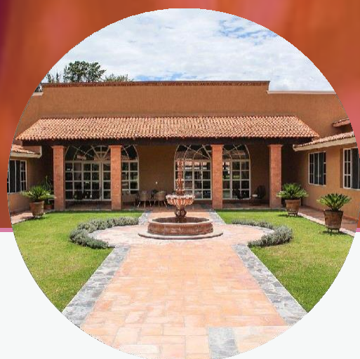
Hotel La Capilla