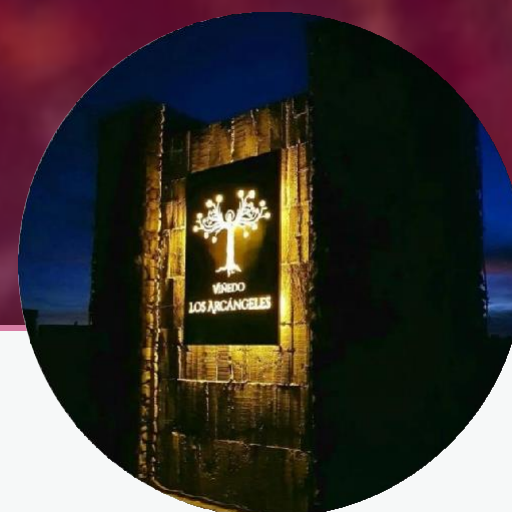
Viñedo Los Arcángeles