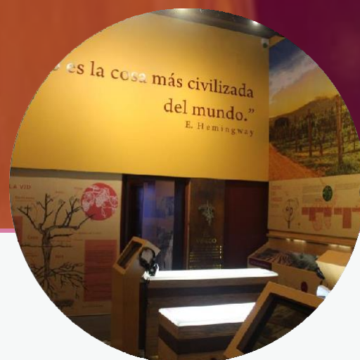
Museo del Vino