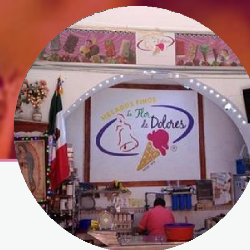
La Flor de Dolores Nevería