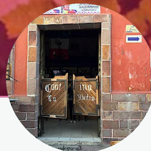
Comacorán Recorrido por Cantinas