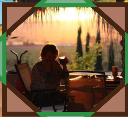
Fundación Cielito Lindo Sustentable A.C