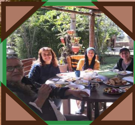
Cabañas los Nogales