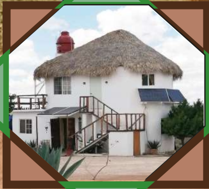
Fundación Cielito Lindo Sustentable A.C