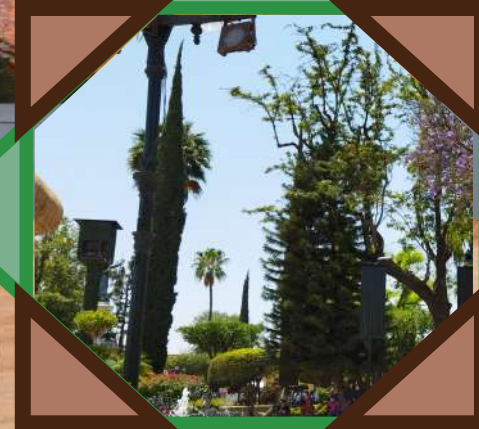
Comacorán Operadora Turística