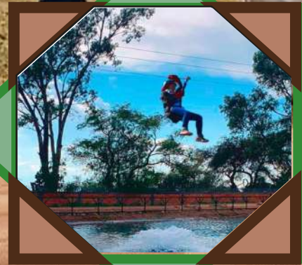
Rancho Santa fe