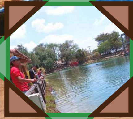
Rancho Santa fe