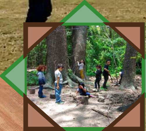
Cabañas los Nogales